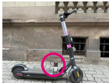
KNOT eScooter Setup with PGM Evaluierungsplattform