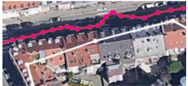
Routenvergleich von GPS und Precise Positioning